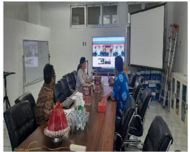
Beberapa Dokumen Prodi S2 PWK tersedia Secara Online