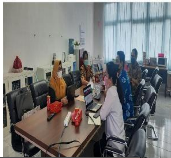
Beberapa Dokumen Prodi S2 PWK tersedia dalam bentuk soft file