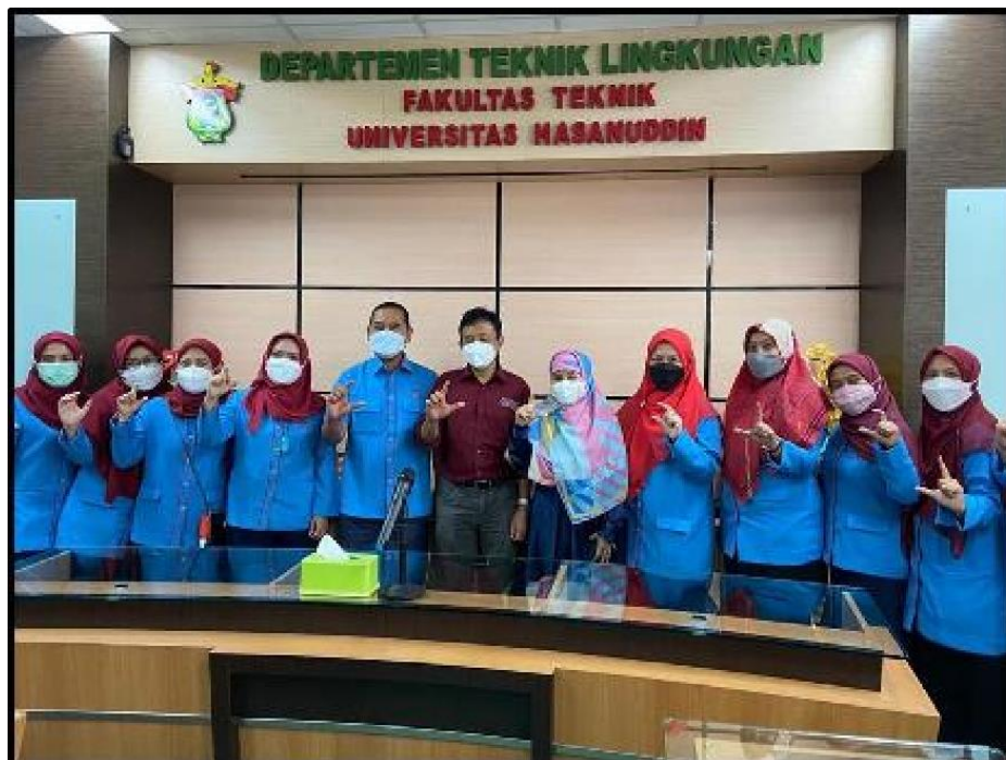
Foto Kegiatan Audit Mutu Internal (AMI) Prodi Magister Teknik Lingkungan FT-UH